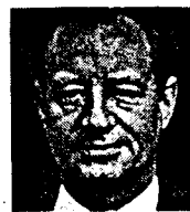
Af udenrigsøkonomiminister Ivar Nørgaard

Ivar Nørgaards artikel er udarbejdet som et fællesindlæg, hvis synspunkter også dækker formændene for de partier, som i folketinget har stemt for Danmarks indtræden i EF.