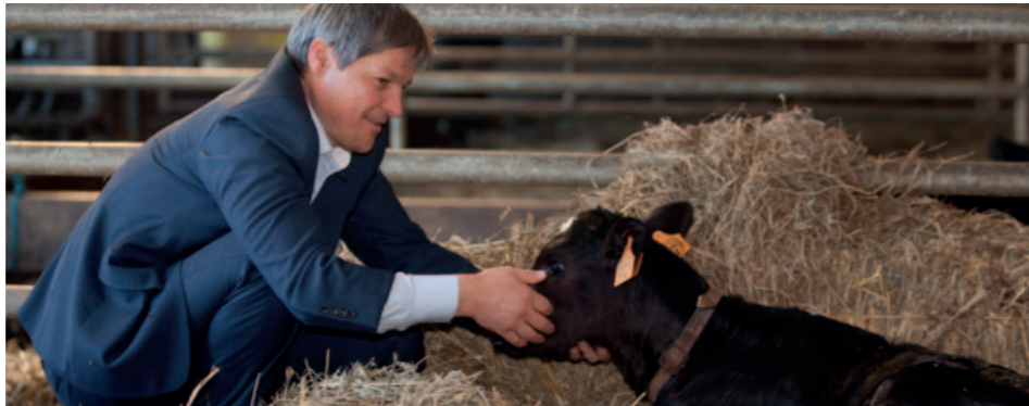
EU's landbrugskommissær, Dacian Ciolos, forsøger at skaffe bred opbakning til sin reformpakke.

De tidligere års reformer fortsættes. Sundhedstjekket medfører øget liberalisering af den direkte landbrugsstøtte. Der overføres endnu en gang flere penge fra den direkte landbrugsstøtte til at udvikle landdistrikterne.