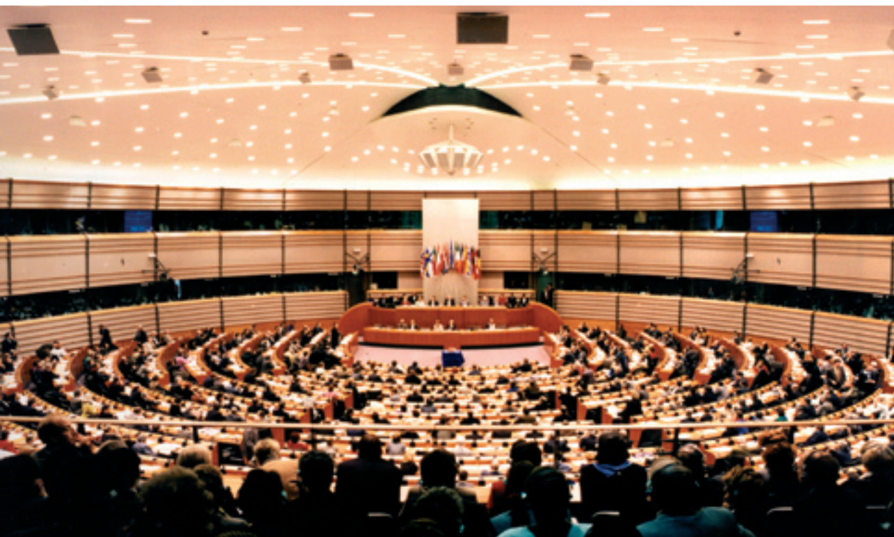
Konventet samles i Europa-Parlamentets store mødesal.

Hidtil er borgerne blevet spurgt om deres holdning til EU i forbindelse med folkeafstemninger, der har fundet sted efter at de politiske beslutninger er truffet, men det skal være anderledes nu. Denne gang skal også helt almindelige mennesker have lov til at komme til orde, inden EU's ledere træffer beslutning.